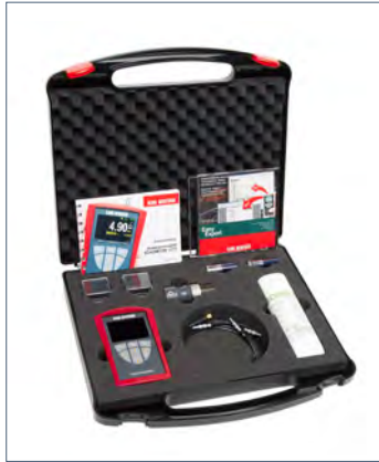
隨貨附贈手提儀器箱