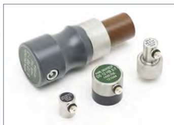
針對需求，可選延遲或無延遲線的探頭